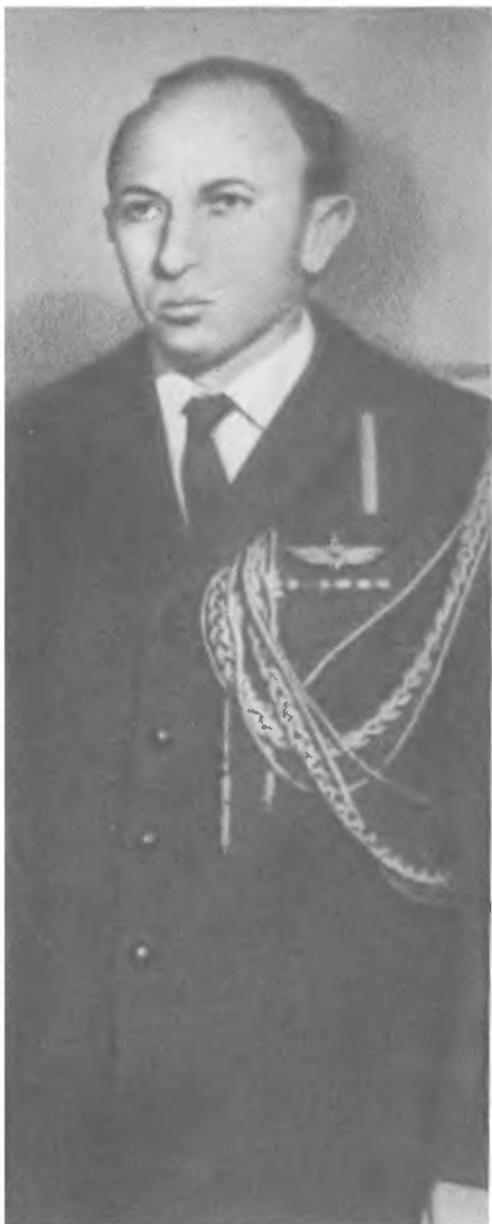
Цви Замир – директор «Моссада» в 1968–1974 годах