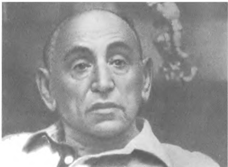
И. Харел – директор «Моссада» в 1952–1963 годах