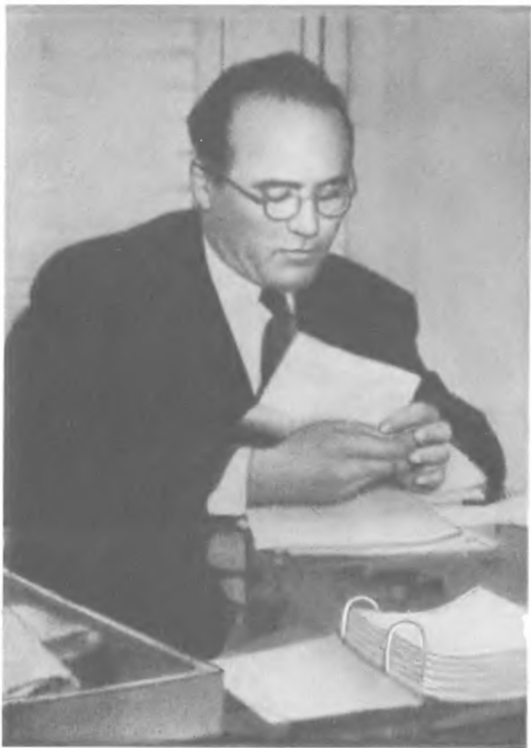
Р. Шилой – первый директор «Моссада»