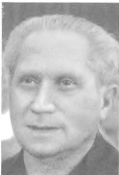
Аарон Ярив – начальник военной разведки Израиля в 1962–1972 годах