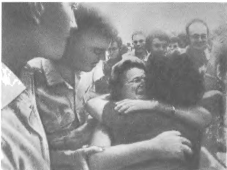
Освобождение израильскими командос заложников в Энтеббе