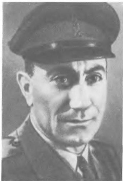
Меир Амит – единственный человек, который возглавлял военную разведку (1962–1963) и «Моссад» (1963–1968)